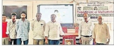
రామానుజన్ కు నివాళులర్పిస్తున్న అధ్యాపకులు

కార్యక్రమంలో: గణిత క్యాన్సెల్లాన్ శ్రీనివాస రామానుజన్ ఆదర్బనీ